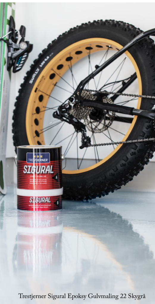
Trestjerner Sigural Epoksy Gulvmaling 22 Skygrå