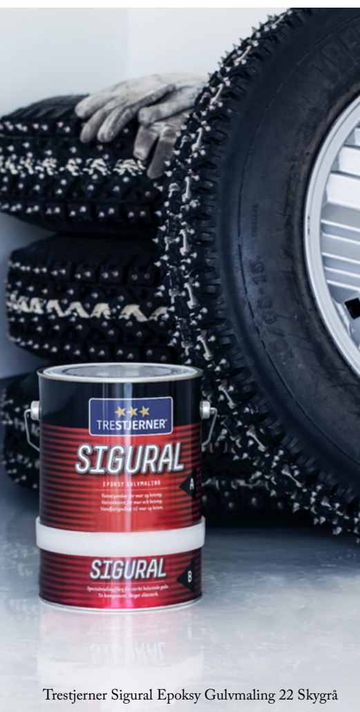
Trestjerner Sigural Epoksy Gulvmaling 22 Skygrå